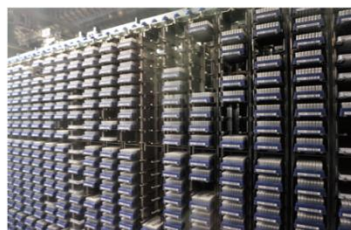
化合物サンプル保管庫